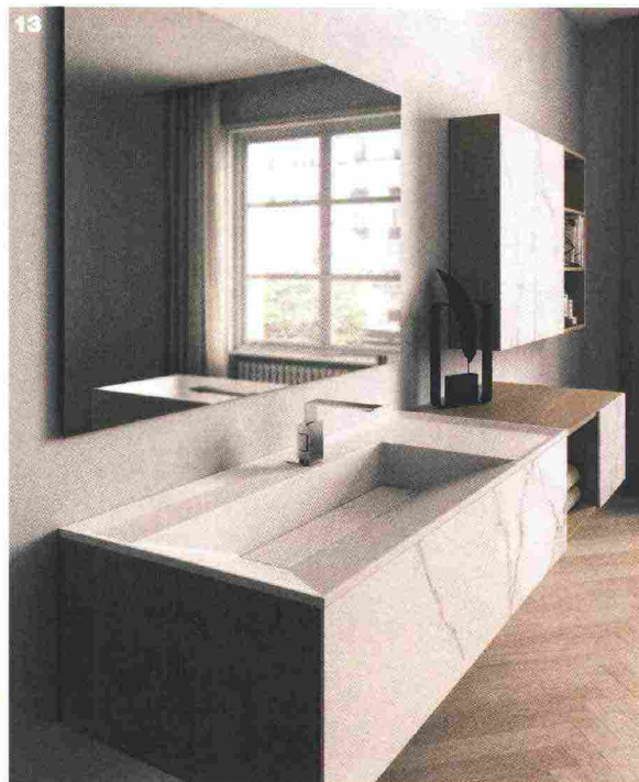
12. Mirage: Xgone, design DeFerrari e Modesti è un rivestimento dove ogni colore è disponibile in tre moduli diversi e in diverse tipologie, dalle più regolari a quelle più complesse. 13. Idea Group: collezione Dogma. Qui una composizione con base sospesa in rovere naturale e grès statuario. Piano con lavabo integrato in Cristalplant, spessore 1,5 cm. 14. Garbelotto: Grigio borghese, un colore disponibile su tutti i parquet, sia prefiniti che massicci. Tutti i prefiniti sono certificati 100% Made in Italy, CE, in classe E1 per l'emissione di formaldeide. 15. Margaroli: Frame, design Pedrizzetti Associati, è uno scaldasalviette in tubo metallico dal design lineare ed essenziale.