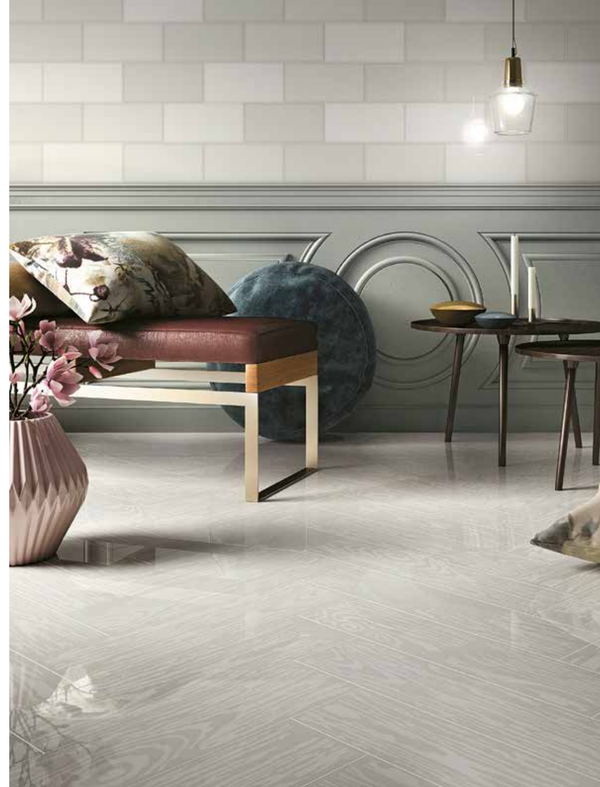
Veel bekijks voor Project Point van Studio Job en Mirage