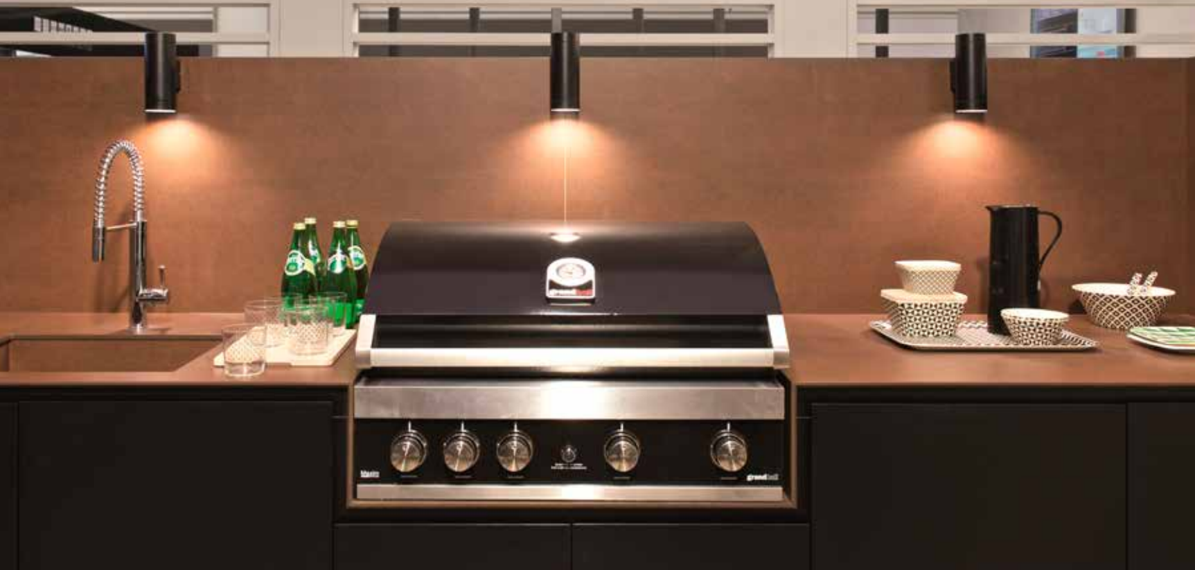
Florim met werkbladen in metal rust van 12mm dik