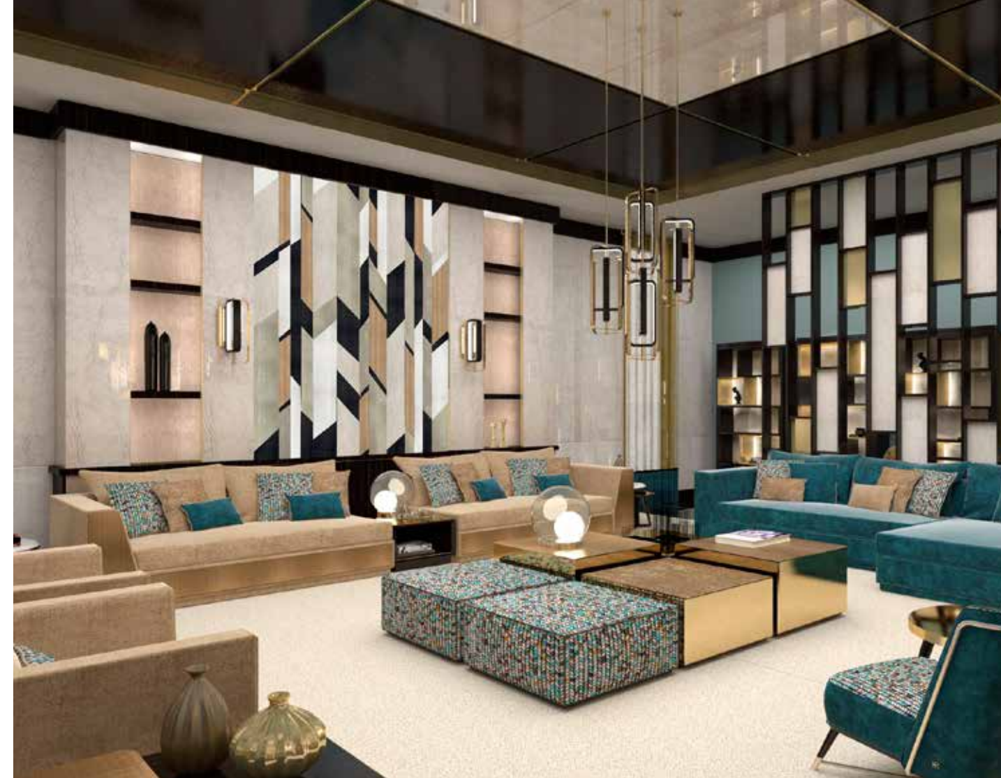
Sicis kleedt de hele woning aan op de Meubelbeurs