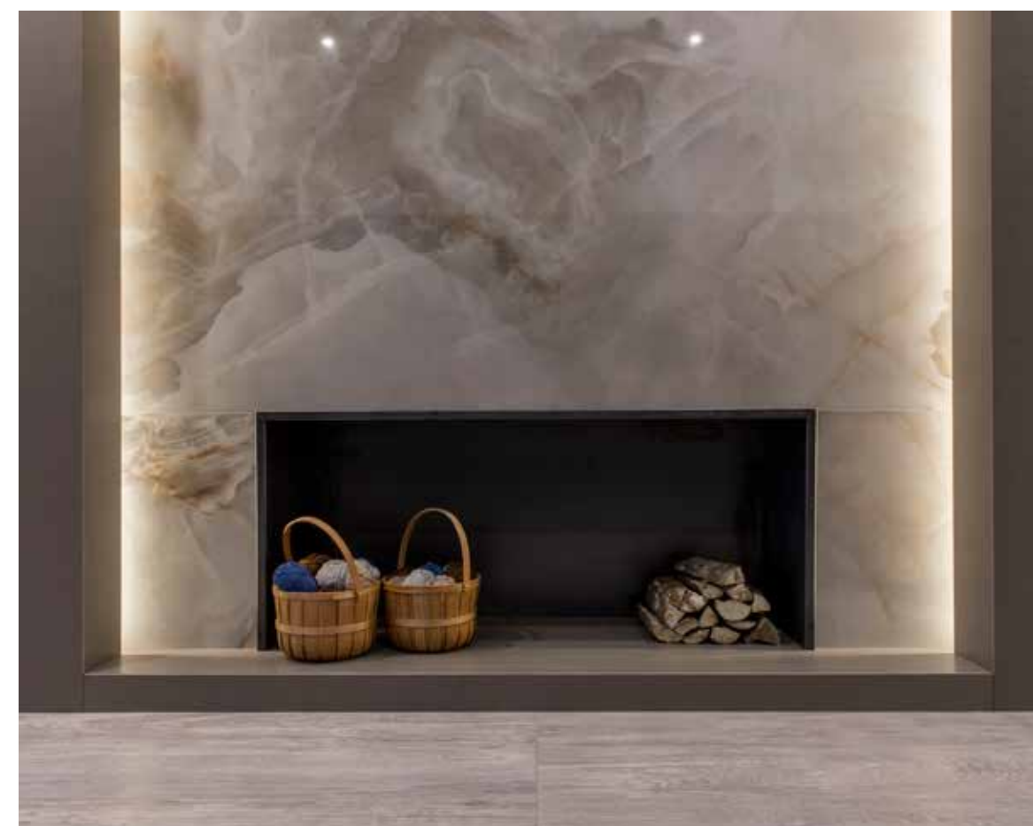
Haardaankleding in marmers met Magnum Oversize van Florim

De voordelen van Magnum Oversize werden goed toegelicht: de dunne platen zijn in verhouding licht, voor vele doeleinden geschikt, resistent en uiteraard mooi. Dat geldt zeker voor de marmerspiraties waarin de