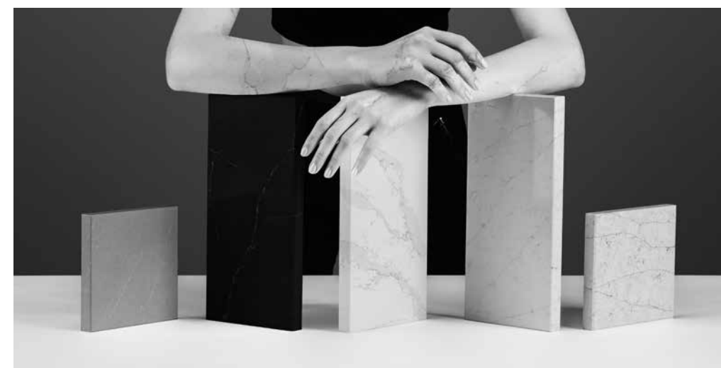
Cosentino met nieuwe marmers in Silestone