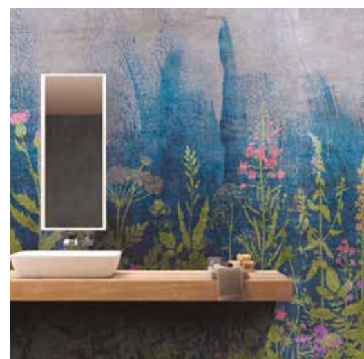
Wide &amp; Style aankleding van ABK

In de hippe wijk Brera had Mirage een plekje verworven om de